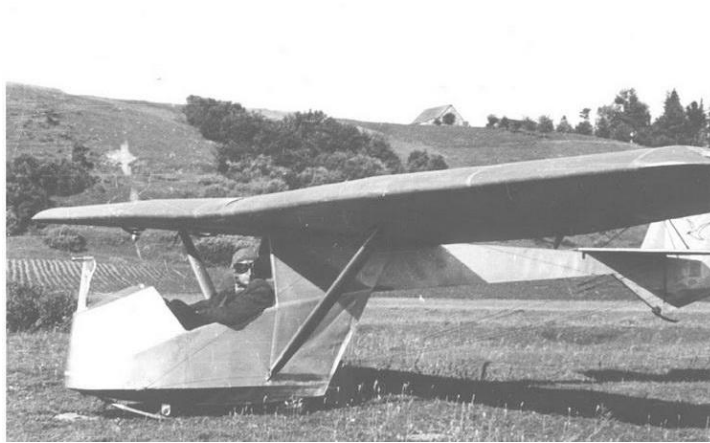
Br. Oškinio sklandytuvas BrO-9 "Žiogas" 1951m