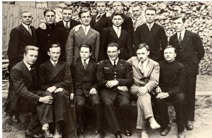
ATM sklandytojų būrelis. 1931 m.