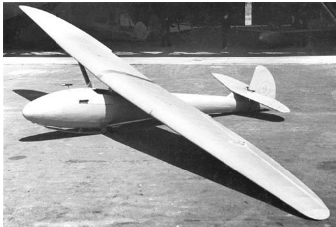
Br. Oškinio sklandytuvas BrO-3 "Pūkas ". 1936 m.